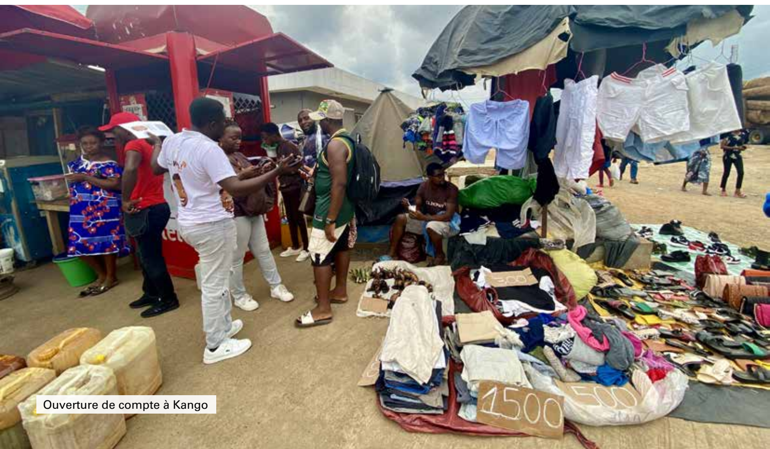
Ouverture de compte à Kango