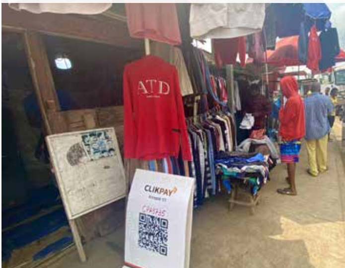
CLIKPAY accepté dans les petits commerces et boutiques

CLIKPAY Gabon entend occuper une part conséquente sur le marché des SFN, sur l'ensemble du territoire gabonais. Pour dérouler ses ambitions, la fintech multiplie les partenariats afin de co-construire un écosystème inclusif des acteurs de la vie économique : commerces, réseau d'agents, grands facturiers, services publics, etc. « Notre objectif est d'abord de bien maîtriser notre premier marché au Gabon, avec des services moins chers, de qualité et d'élargir notre offre en intégrant les supermarchés, les sites de e-commerce par exemple », indique la direction de CLIKPAY Gabon. Reste à faire sur le terrain un travail important de mobilisation des acteurs de l'écosystème, qui passe notamment par des négociations avec les prestataires de services divers (eau, électricité, téléphone, abonnement TV, e-commerce...) afin de les interconnecter au système CLIKPAY. Le déploiement dans les pays de la Communauté économique et monétaire d'Afrique centrale (CEMAC), grâce à l'agrément COBAC, viendra plus tard.