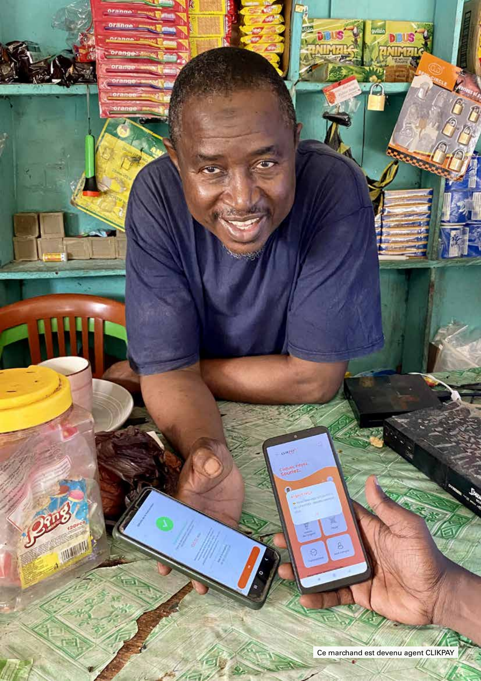
Ce marchand est devenu agent CLIKPAY