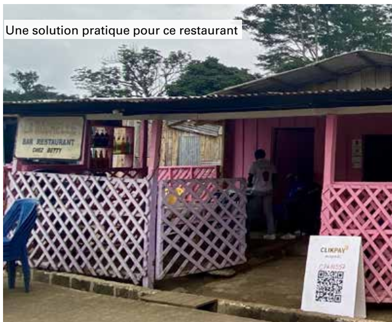
Une solution pratique pour ce restaurant